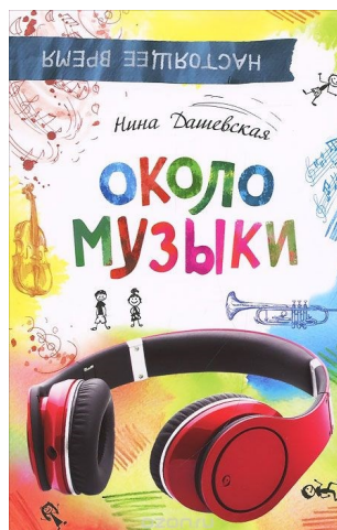
Дашевская Н., Около музыки/Нина Дашевская Росмэн. 2015

Обычный человек так бежит, когда на поезд опаздывает. А для Игната - нормальная скорость. Самое то, на роликах или на самокате. Так лучше ощущаешь связь с миром, а в нем всё интересно: и люди, и город, и музыка, и книги... да всё. И мыслей об этом у Игната полно. Своих, ни у кого не занятых. Только вот делиться он ими не любит, да и не с кем - кто же за ним поспеет? Хотя Игната все любят. Он это случайно как-то понял - удивительно, да? Но он много чего, оказывается, еще не догоняет. Например, что у него друг есть на самом деле. И не один. Или что некоторые всерьез собираются жизнь посвятить помощи другим людям... Ничего, он не тормоз, догонит. В общем, да, иногда и самокатному ангелу надо отдохнуть. Повесть "Я не тормоз" писательницы Нины Дашевской, уже хорошо известной и полюбившейся читателям по